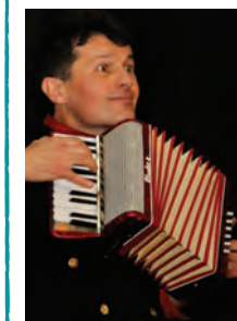
Illustration - Cécile Drevon

Avec la pratique de ces différentes disciplines il accompagne l'enfant, l'adolescent ou l'adulte dans la découverte, la compréhension et la maîtrise de son corps et de ses émotions. Les jeux et les contraintes proposées ont pour but d'amener les comédiens à avoir confiance en eux et en leurs partenaires. C'est pourquoi il attache une attention particulière à les adapter aux capacités de chaque stagiaire. Pour lui, le théâtre doit valoriser chaque acteur et actrice dans ses forces et ses faiblesses du quotidien. Les faiblesses pouvant devenir des atouts sur scène. Cette démarche l'a amené depuis 2016 à l'apprentissage de la langue des signes.